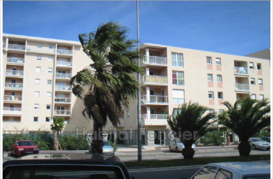
Apartment 1113 Perpignan